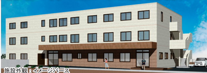
施設外観：イタダキパス