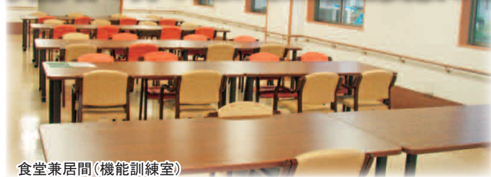
食堂兼居間(機能訓練室)