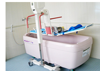
▲一般浴だけでなく機械浴も完備しています