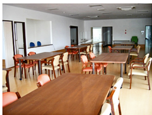
▲明るく清潔食堂兼機能訓練室