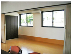
▲静養室。ベッドも備えてあります。