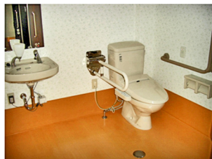
▲車椅子対応のゆったり広めのトイレ