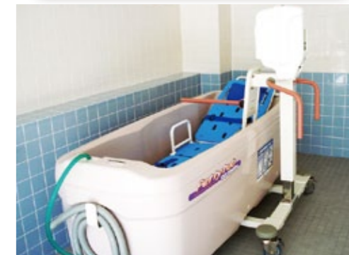
▲寝たままでも入れる特殊浴も完備しています。