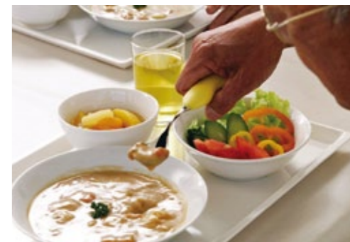
※平面図と現況が異なる場合には現況が優先となります。 ▲バランスを考えた食事。刻み、ペーストにも対応