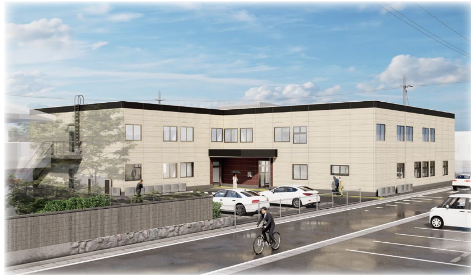
※イメージパースのため、実際とは異なる場合があります。