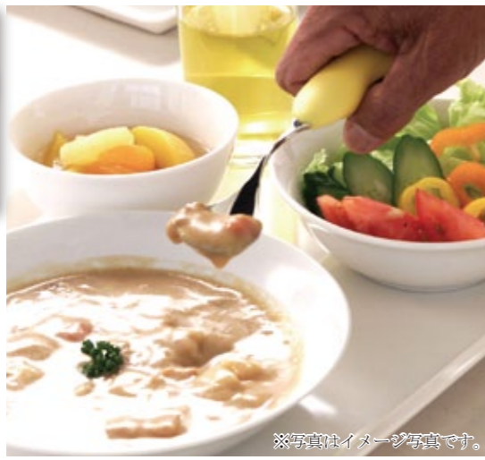
※写真はイメージ写真です。