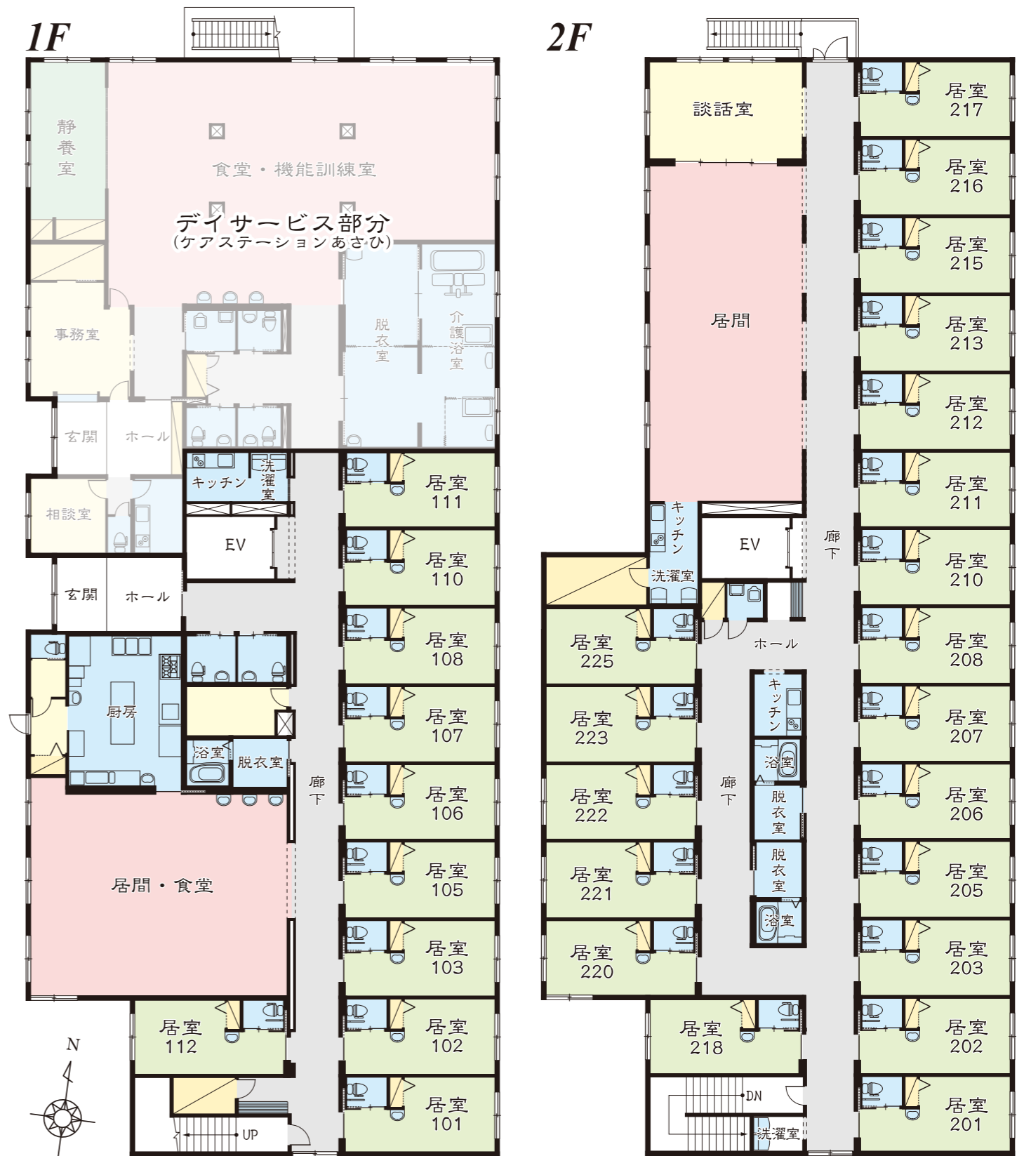
※平面図と現況が異なる場合には、現況が優先となります。