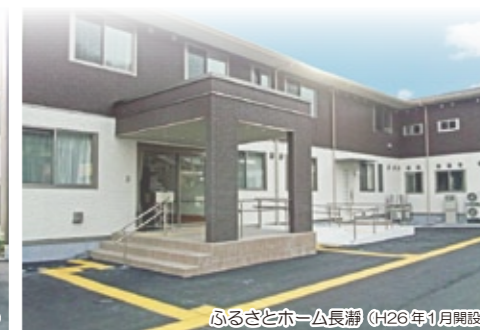
ふるさとホーム長瀬 (H26年1月開設)