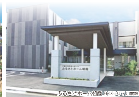
ふるさとホーム朝霞 (H25年7月開設)