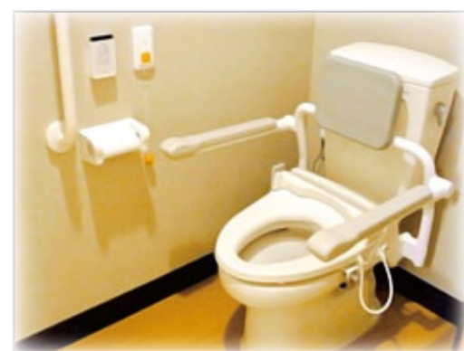
【車椅子対応のトイレスペース】