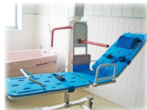
【座浴・寝浴対応の機械浴】