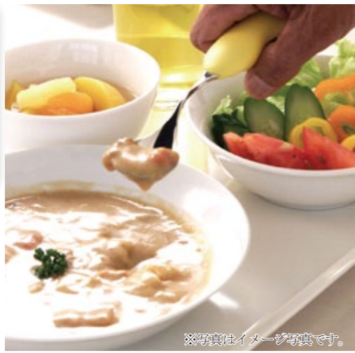
※写真はイメージ写真です。