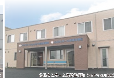
ふるさとホーム高崎箕郷町 (2024年9月開設)