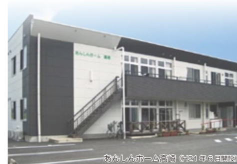
あふれんぼー高崎 (2021年6月開設)