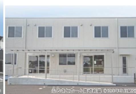
ふるさとホーム高崎 (2023年9月開設)