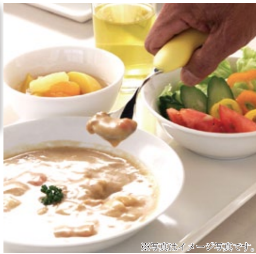
※写真はイメージ写真です。