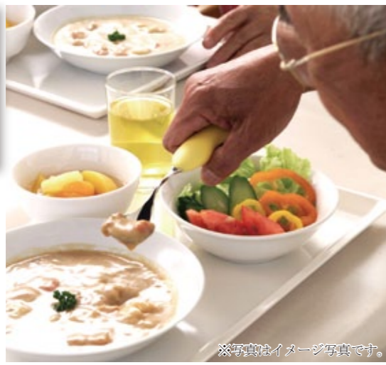
※写真はいメージ写真です。