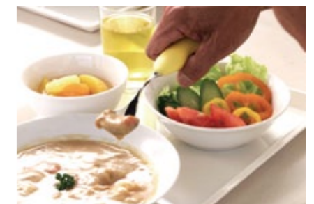
栄養バランスの良い食事