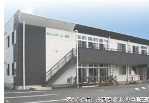
あかしんホーム高崎 (2021年6月開設)