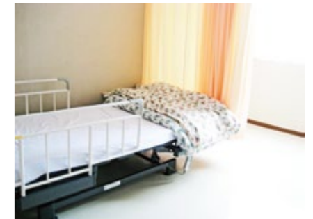
寝起しが楽な電動ベッド

車椅子対応のトイレ周りや機械浴、電動ベッドなど低価格ながら充実の設備。お食事もお状態に合わせてご提供いたします。