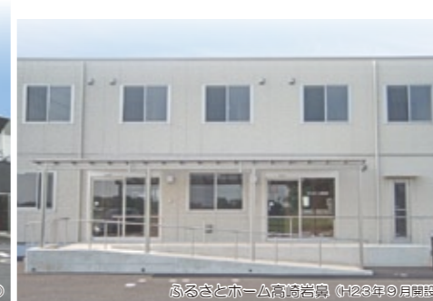
ふるさとホーム高崎岩間 (2023年9月開設)