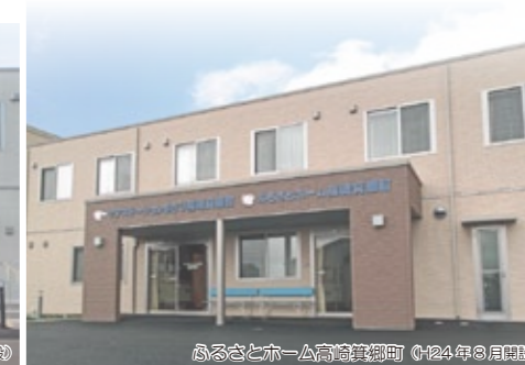
ふるさとホーム高崎箕郷町 (2024年3月開設)