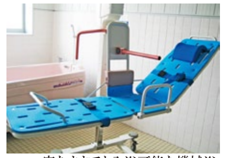
寝たままでも入浴可能な機械浴