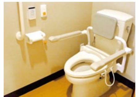
車椅子対応のトイレスペース