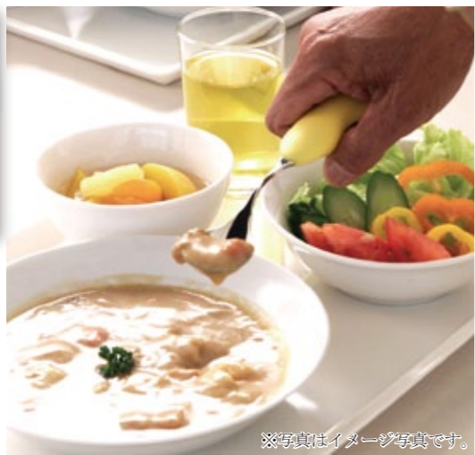
※写真はイメージ写真です。