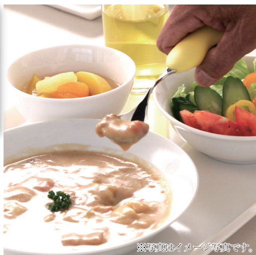
※写真はイメージ写真です。