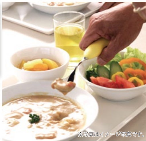
※写真はイメージ写真です。