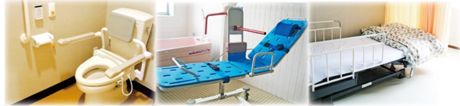
※平面図と現況が異なる場合には、現況が優先となります。※写真はすべてイメージです。