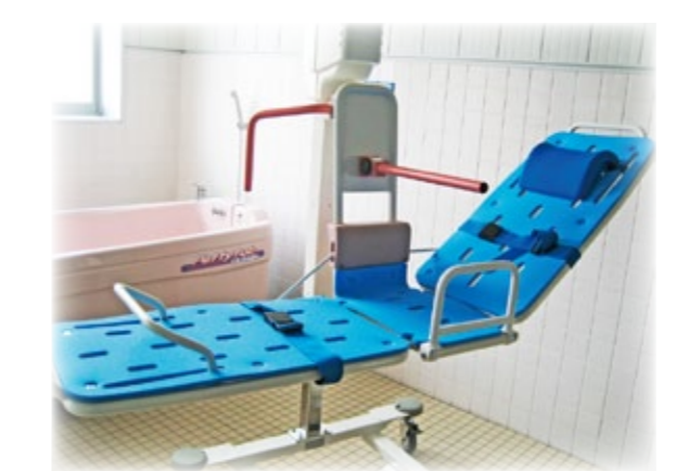
※写真はイメージ写真です。

車椅子対応のトイレスペースや 寝ている状態のままでも入浴可能な 機械浴、電動ベッド等も完備しています。