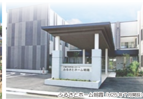
ふるさとホーム朝霞 (H25年7月開設)