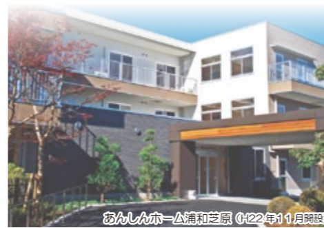
あんしんホーム浦和芝原 (H22年11月開設)