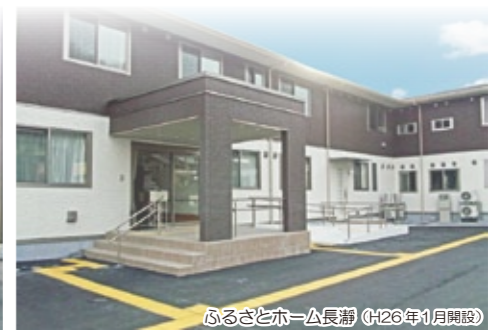
ふるさとホーム長瀬 (H26年1月開設)