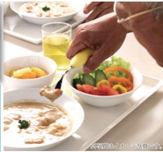
※写真はイメージ写真です。