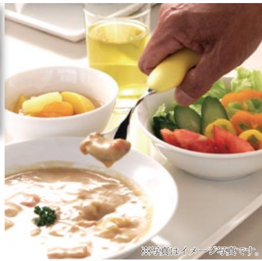
※写真はイメージ写真です。