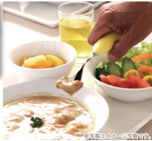
※写真はイメージ写真です。