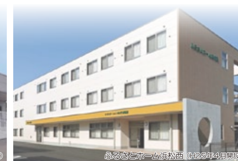
ふるさとホーム浜松西 (H25年4月開設)