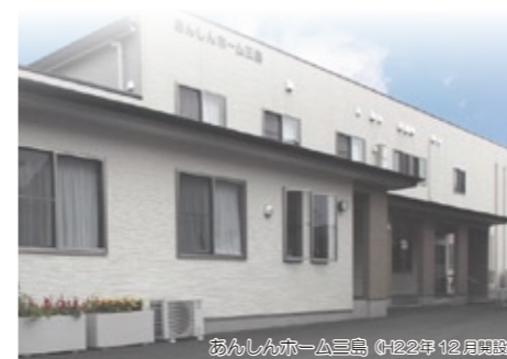
ふるさとホーム三島 (H22年12月開設)