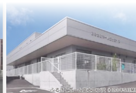
ふるさとホーム富士市 (H23年5月開設)