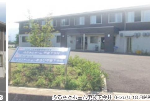
ふるさとホーム甲斐下今井 (H26年10月開設)