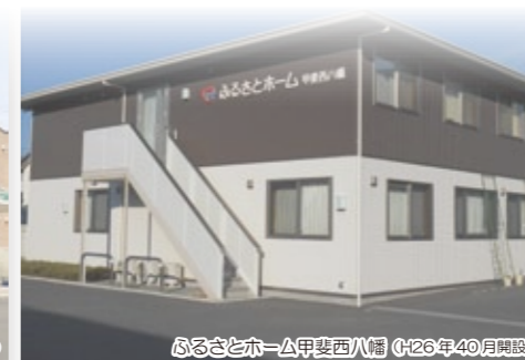
ふるさとホーム甲斐西八幡 (H26年40月開設)