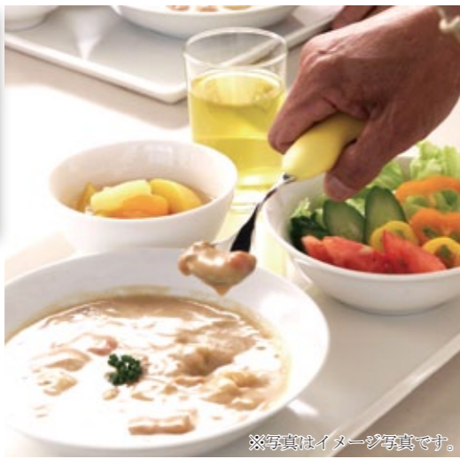
※写真はイメージ写真です。