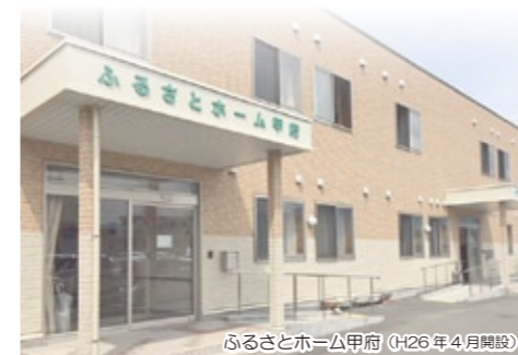
ふるさとホーム甲府 (H26年4月開設)