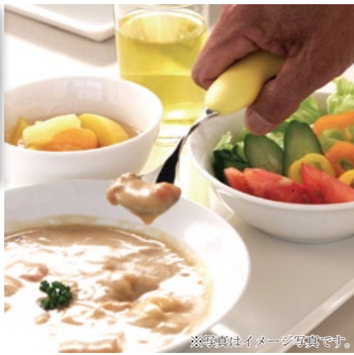
※写真はイメージ写真です。