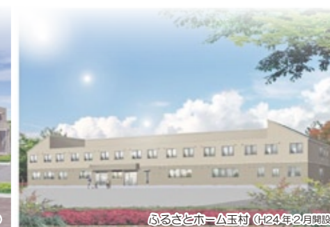
ふるさとホ-△玉村 (H24年2月開設)