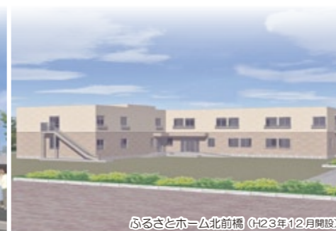
ふるさとホ-△北前橋 (H23年12月開設)