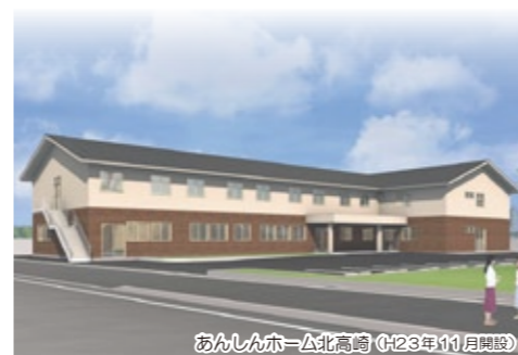
あんしんホ-△北高崎 (H23年11月開設)