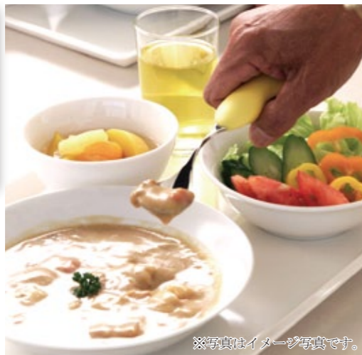
※写真はイメージ写真です。