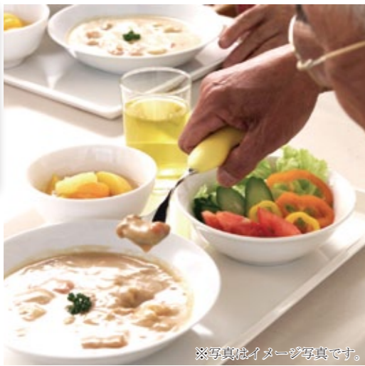
※写真はイメージ写真です。