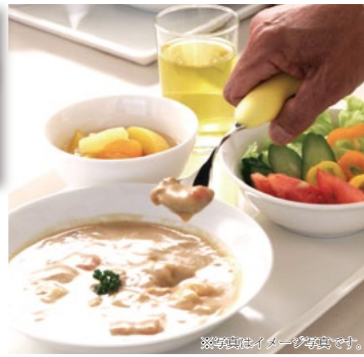
※写真はイメージ写真です。