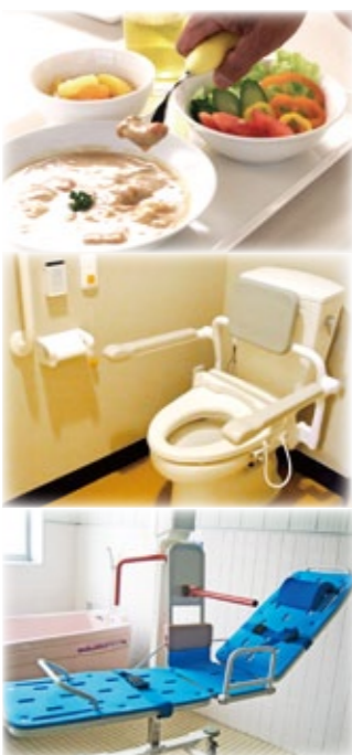
※写真はイメージ写真です。