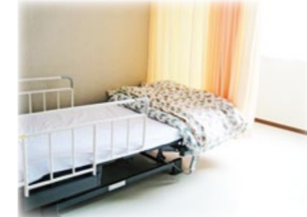
【備え付けの電動ベッド】 ※写真はすべてイメージです。