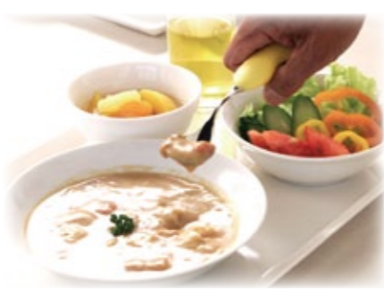
【お食事】 旬の味覚を大切にバランスと消化を考慮したメニューです。入居者様おひとりおひとりに適した状態でご提供いたします。