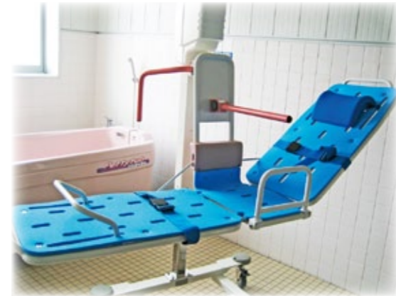
【座位・仰臥位入浴可能な機械浴】