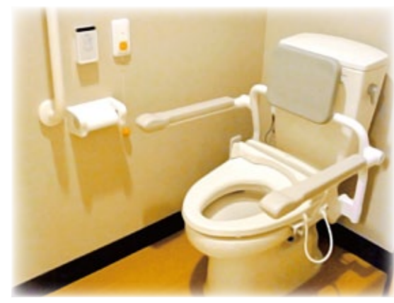
【車椅子対応のトイレスペース】