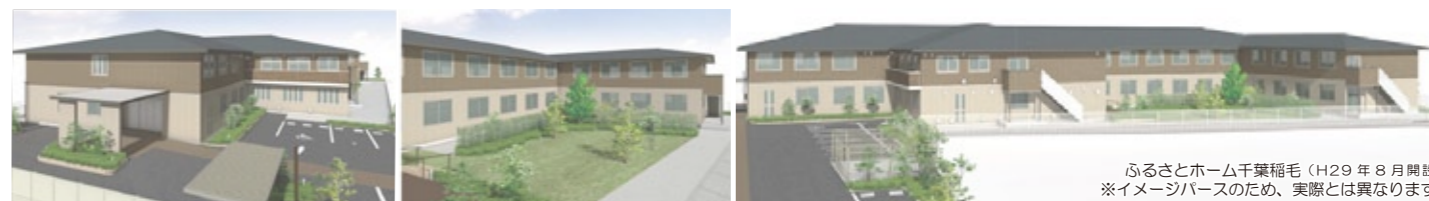
ふるさとホーム千葉稲毛 (H29年8月開設) ※イメージバースのため、実際とは異なります。