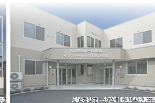
ふるさとホーム綾瀬 (H26年5月開設)