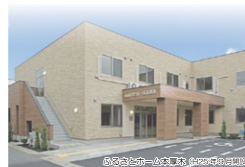
ふるさとホーム本厚木 (H25年9月開設)