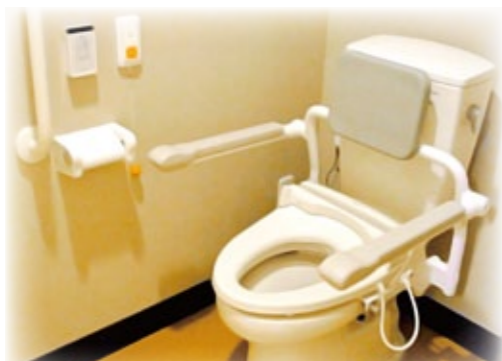
【車椅子対応のトイレスペース】