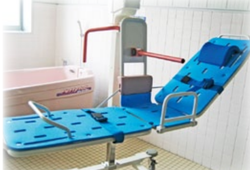
【座位・仰臥位入浴可能な機械浴】