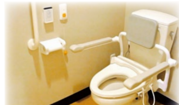
【車椅子対応のトイレスペース】

旬の味覚を大切に栄養バランスと消化を考慮。入居者様に適した状態でご提供いたします。