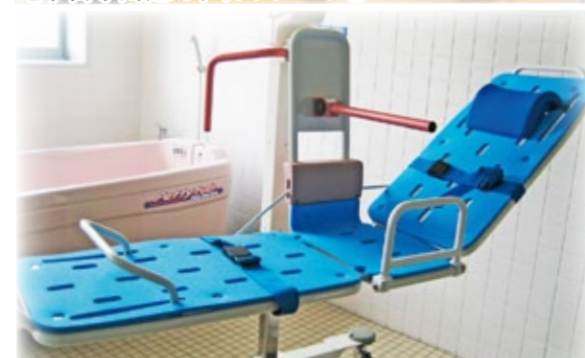
【座位・仰臥位入浴可能な機械浴】