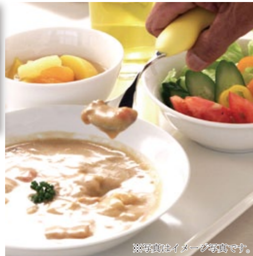
※写真はイメージ写真です。