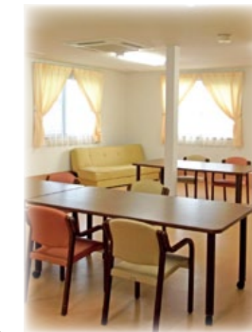
※平面図と現況が異なる場合には、現況が優先となります。