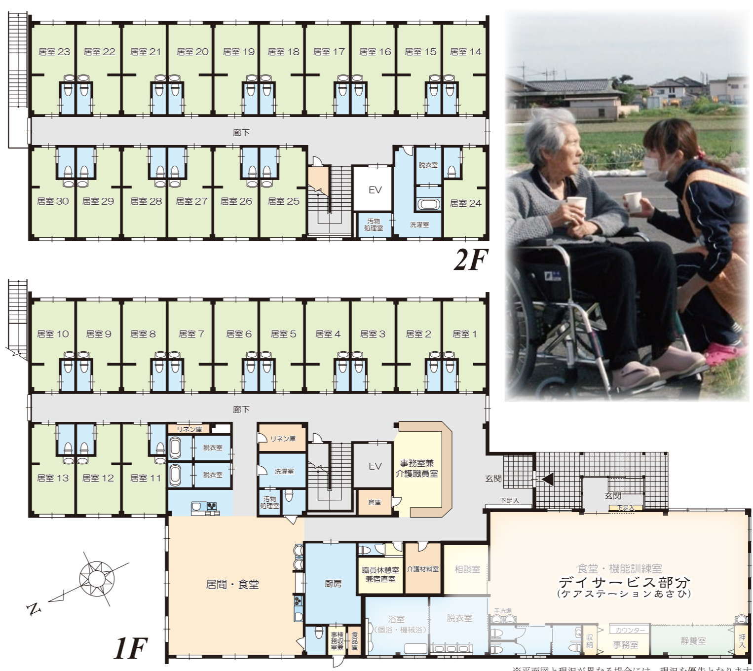
※平面図と現況が異なる場合には、現況を優先となります。