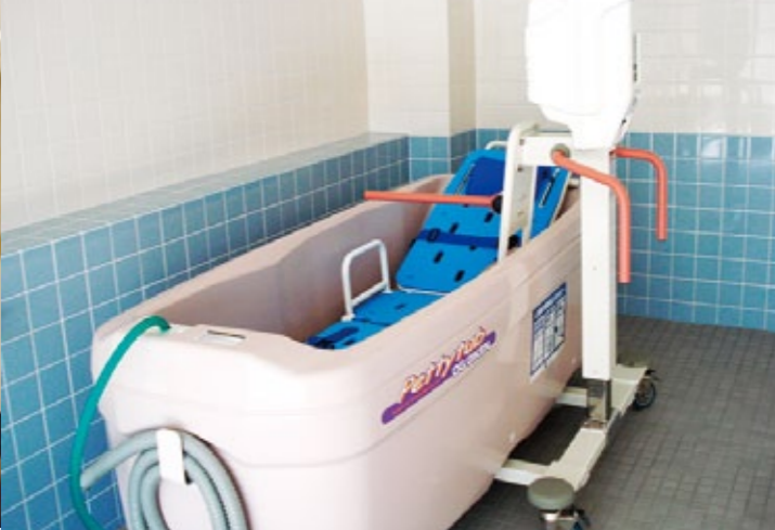
※写真はイメージ写真です。