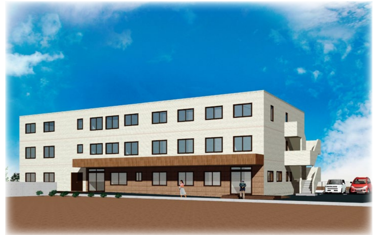
※イメージパースのため、実際とは多少異なります。