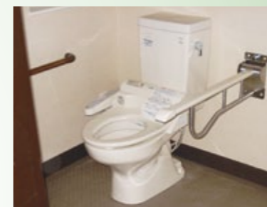
▲トイレ(車いす対応・可動式手すり付)