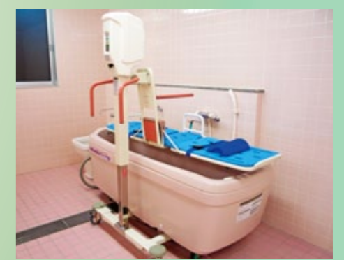
▲一般浴の他に機械浴も完備しています