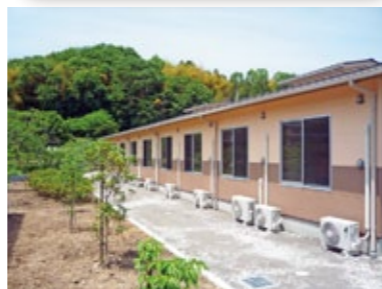
▲緑豊かな自然に恵まれた静かな環境

入居者随時募集中 体験入居もできます。 *1泊5,500円(税込)別途食事代* お気軽にお問合せ下さい。