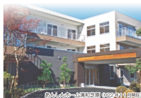
あんしんホーム浦和芝罘 (H22年11月開設)