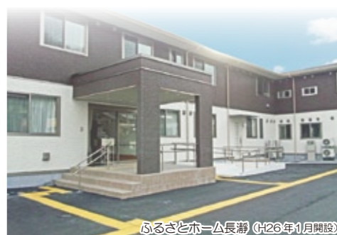
ふるさとホーム長瀬 (H26年1月開設)