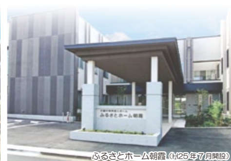
ふるさとホーム朝霞 (H25年7月開設)